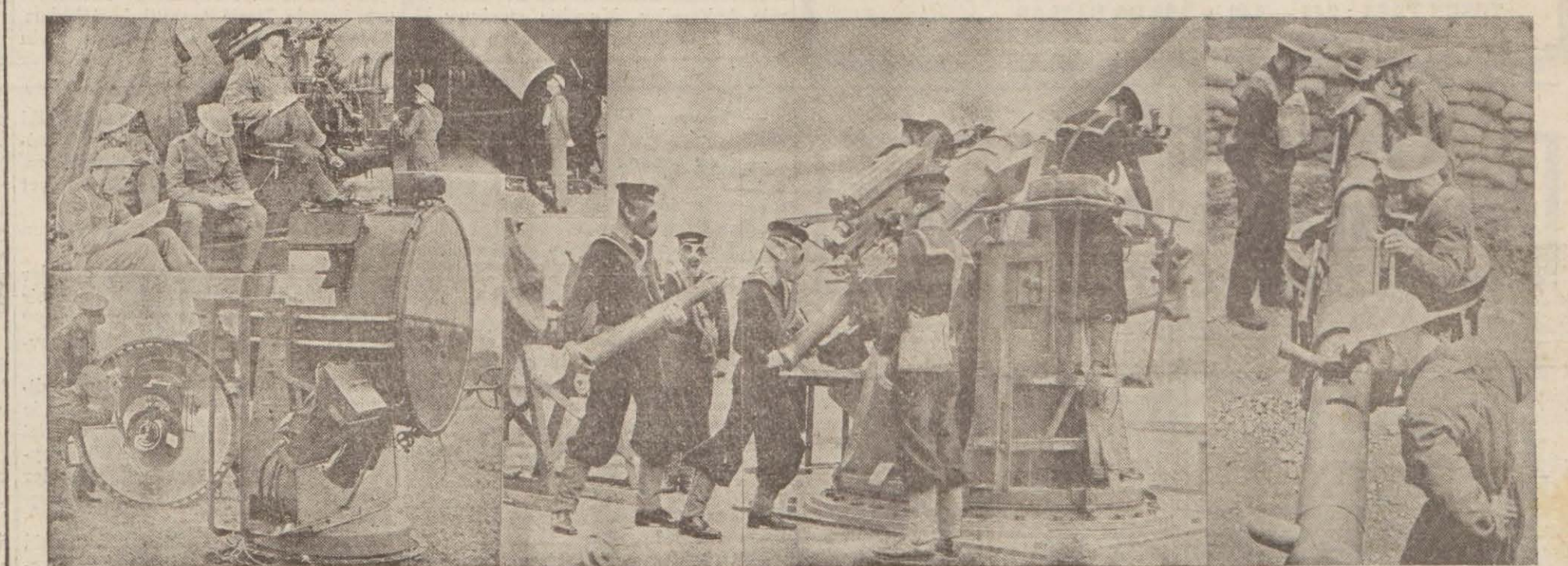
İngilterede hava müdafaaı için alınan tedbirler

Büyük ve umumî taarruzun bugünlerde yapılacağı hakkında şüpheye yer bırakılmıyacak haberler gelmektedir. Taarruz çok müthiş olacak