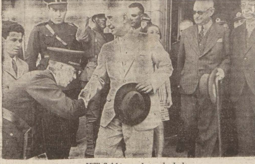
Millî Şef bir seyahate çıkarılarken

B. N. Menemenciğlunun riyasetindeki heyet Londrada malî anlaşmanın tatbiki için müzakerelerde bulunacak